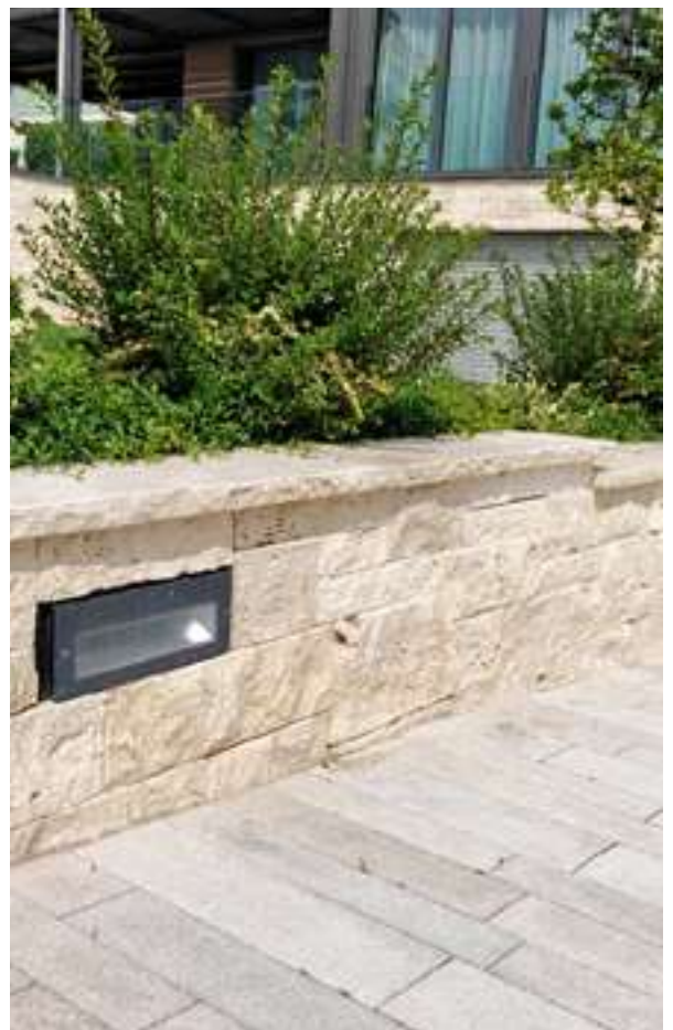
Mauersteine Travertin beige