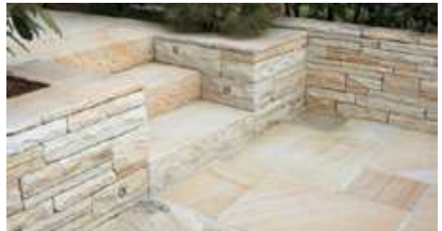
Bodenplatten Sandstein beige 2