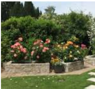
10.245 Muschelkalk getrommelt