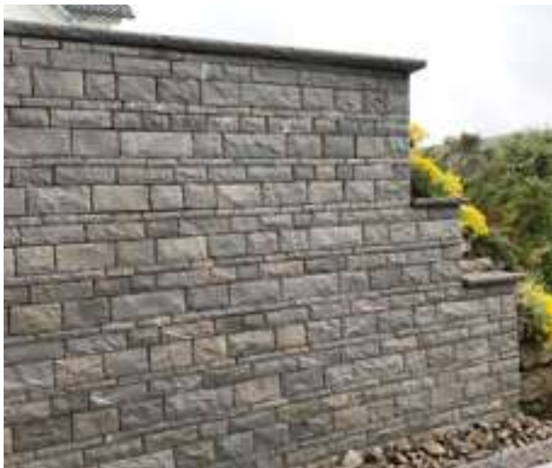
Verblender Pietra Piasentina