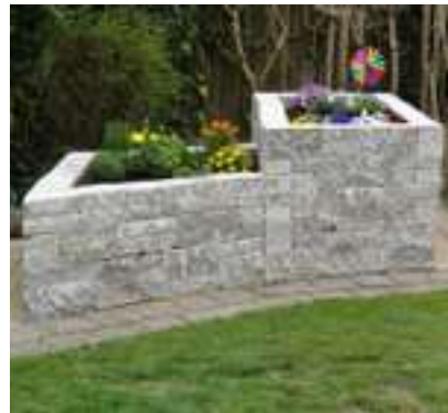
10.245 Muschelkalk getrommelt