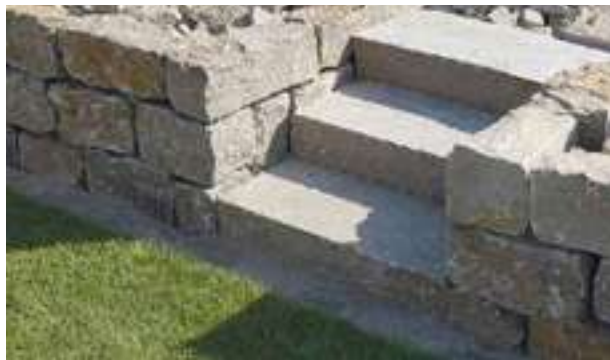
10.235 / 10.240 Muschelkalk gespalten