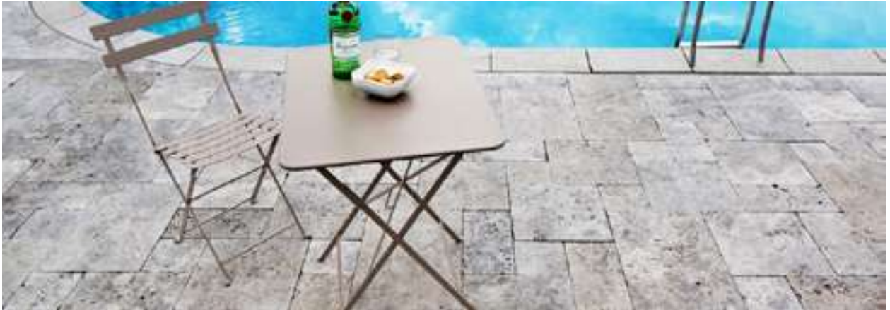
Mauersteine – Palisaden – Pflastersteine – Verblender auf Anfrage.