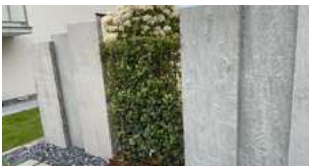
Sichtschutz Sandstein grau