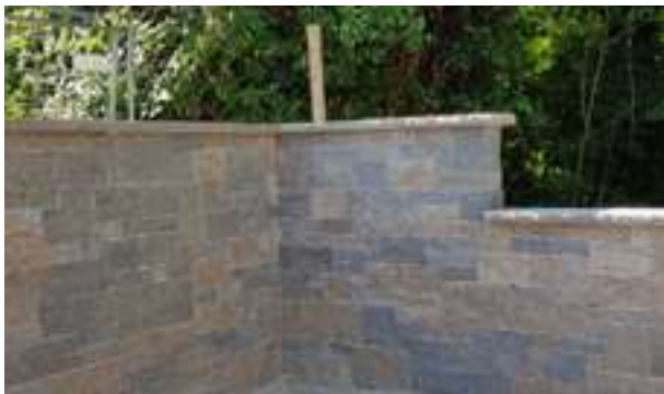
10.250 Muschelkalk gesägt, gespalten