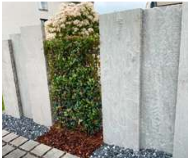
Palisaden Sandstein grau