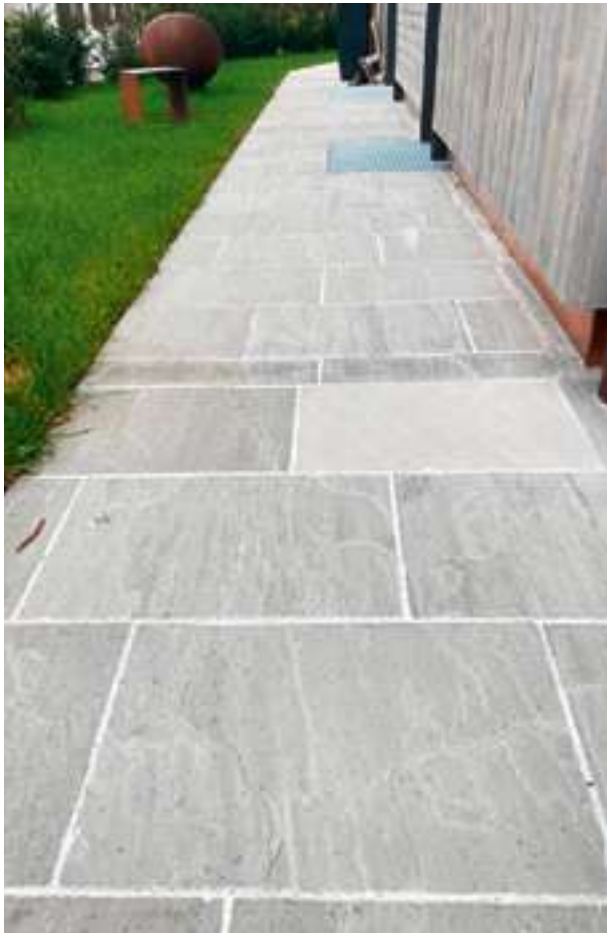
Bodenplatten Sandstein grau