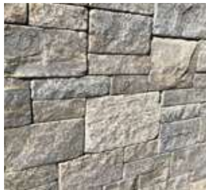
10.245 Muschelkalk getrommelt