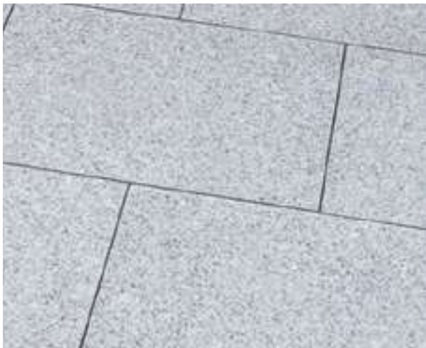
40.225 Bodenplatte Granit hellgrau China geflammt