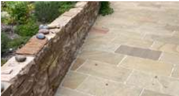
Bodenplatten Sandstein beige 1