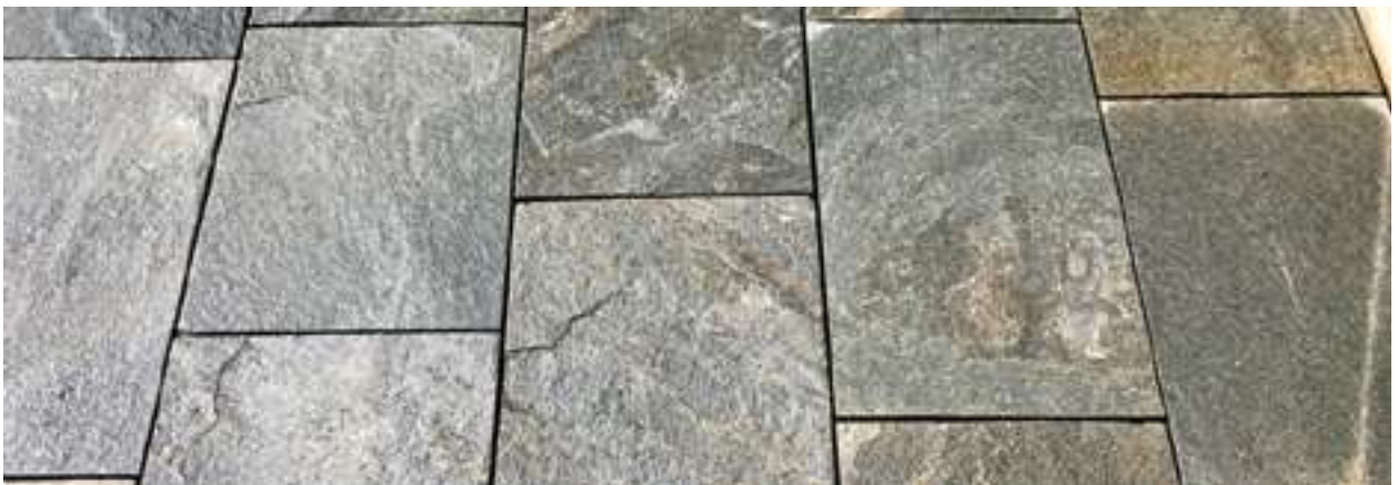
Mauersteine – Palisaden – Pflastersteine – Verblender etc. auf Anfrage.

Fugenkreuze siehe Seite 56/Rompox-Fugenmaterial siehe Seiten 49–52