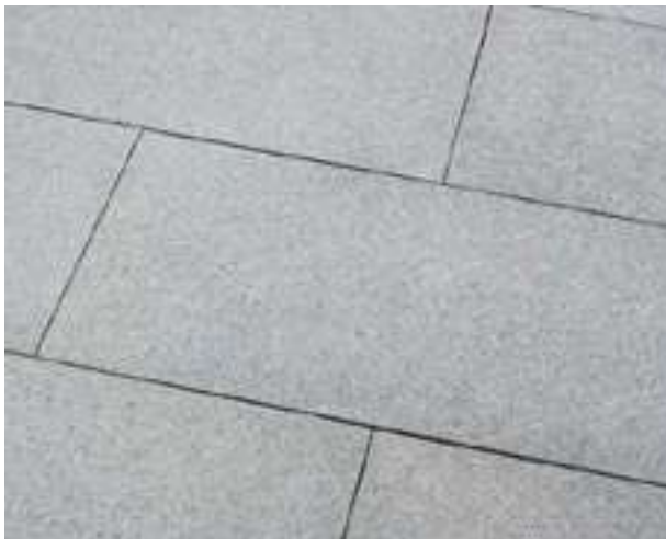
40.230 Bodenplatte Granit mittelgrau China geflammt