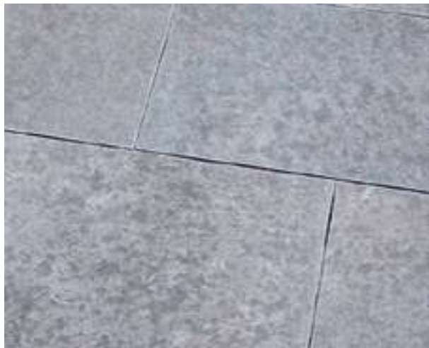
40.235 Bodenplatte Basalt anthrazit Vietnam geflammt