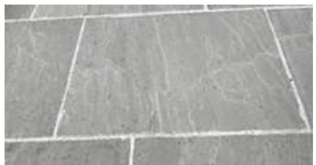
Bodenplatten Sandstein grau

Palisaden – Pflastersteine – Verblender auf Anfrage.