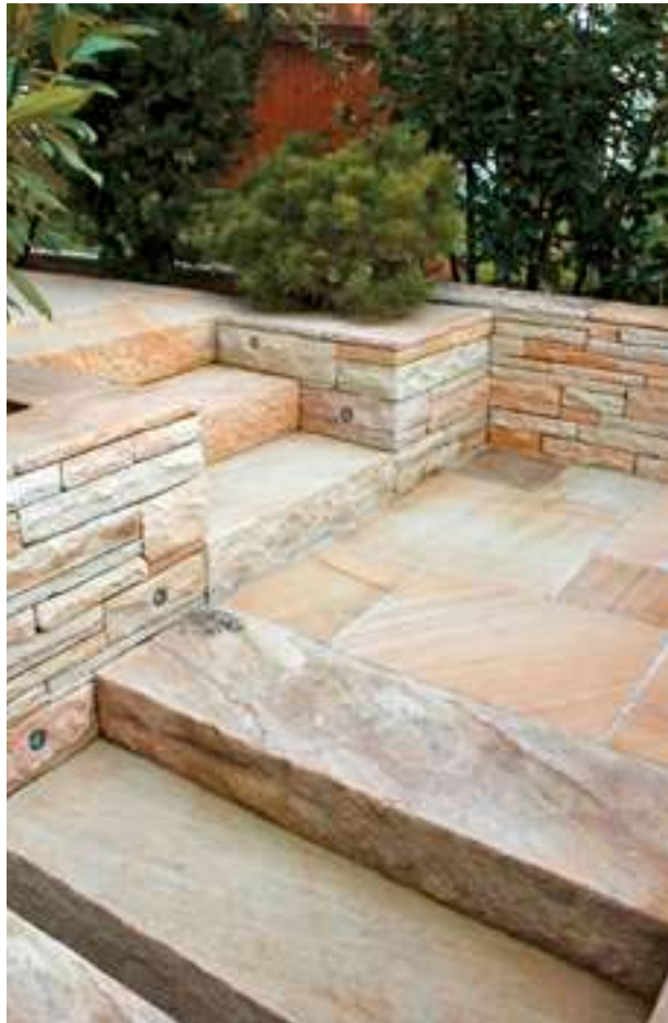
Bodenplatte und Mauersteine Sandstein beige