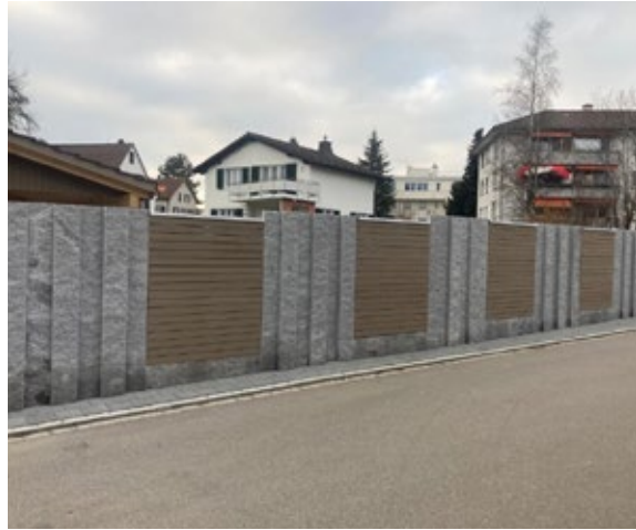
Palisaden Lodrino 1