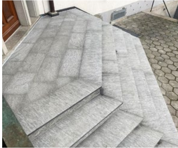
Trittplatten Maggia kugelgestrahlt