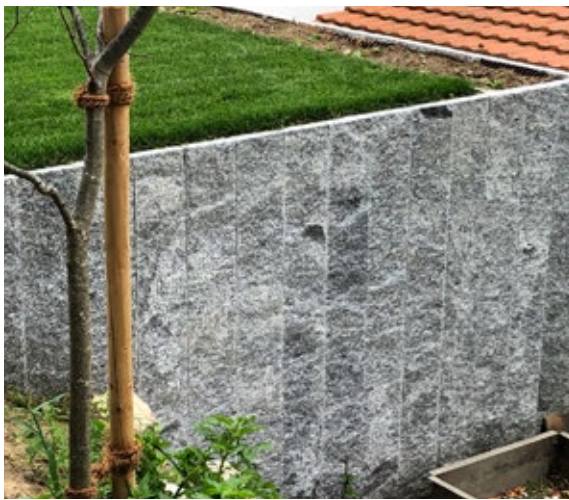
Palisaden Lodrino 2