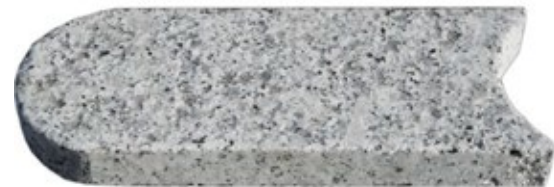
Rasenkanten Granit hellgrau