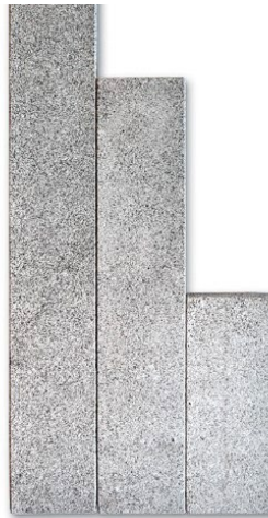
Palisaden Granit hellgrau