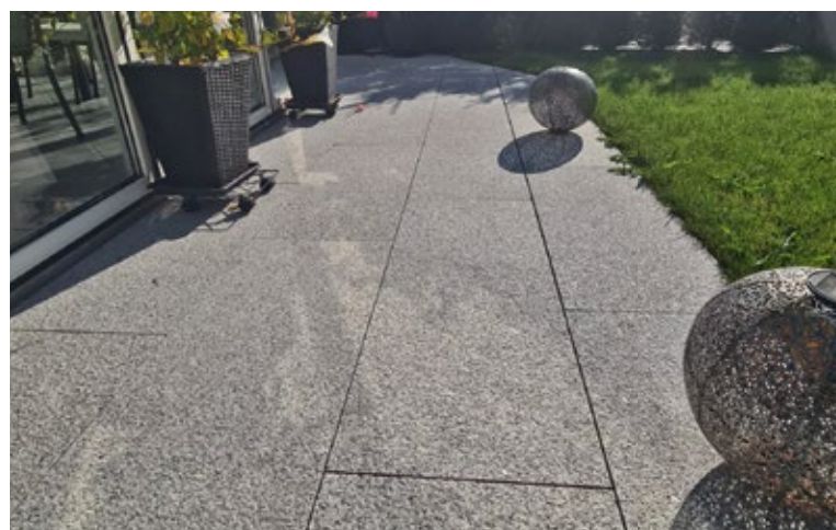
Bodenplatten Granit hellgrau